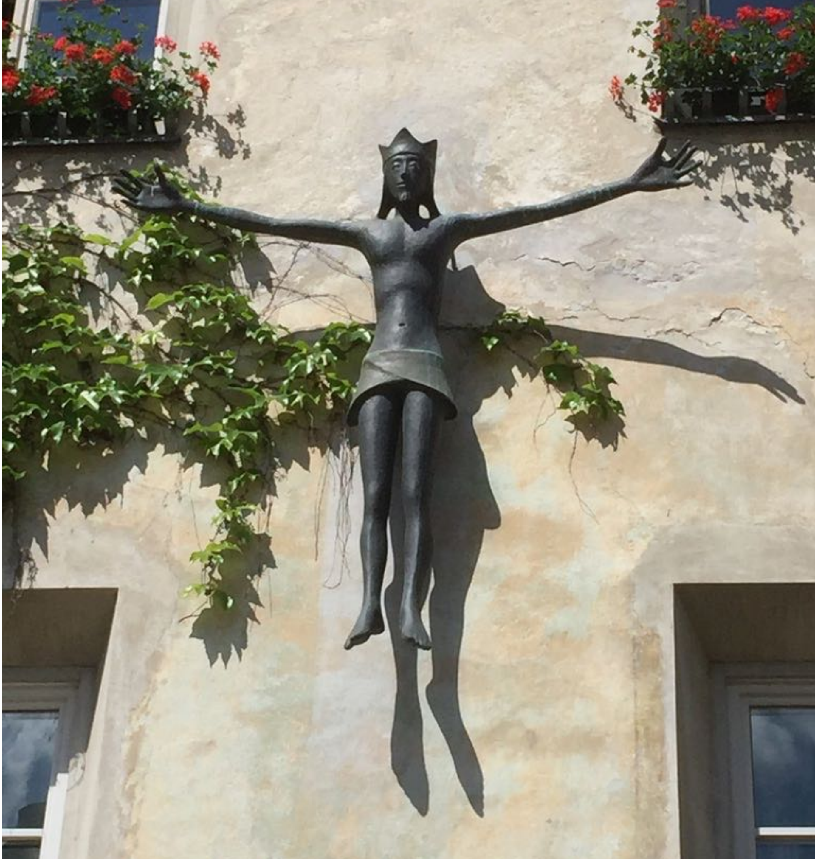
Christusfigur von Martin Rainer (I) an der Hauswand des Pfarrhofs in Brixen