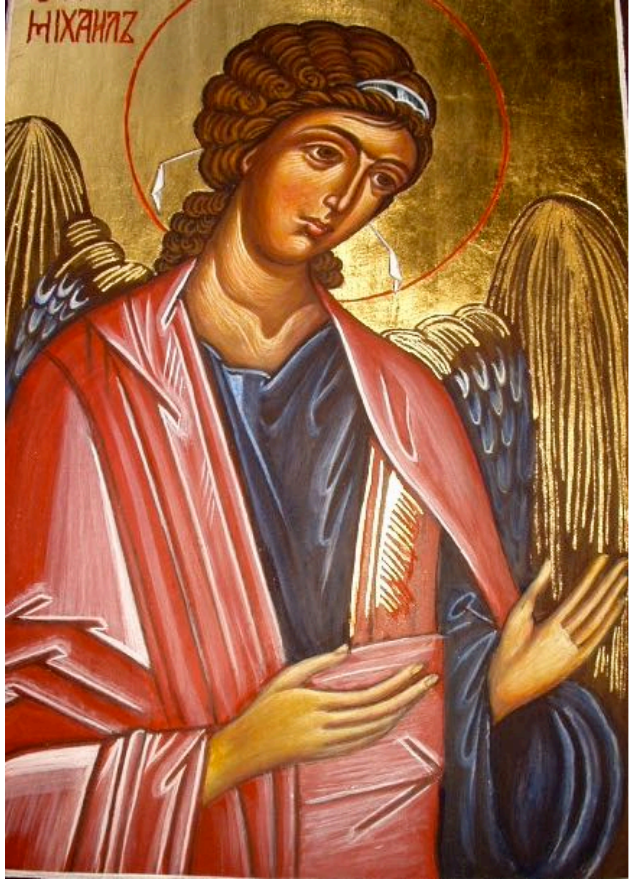
Engel, Ikonenmalkurs Seitenstetten, 2009