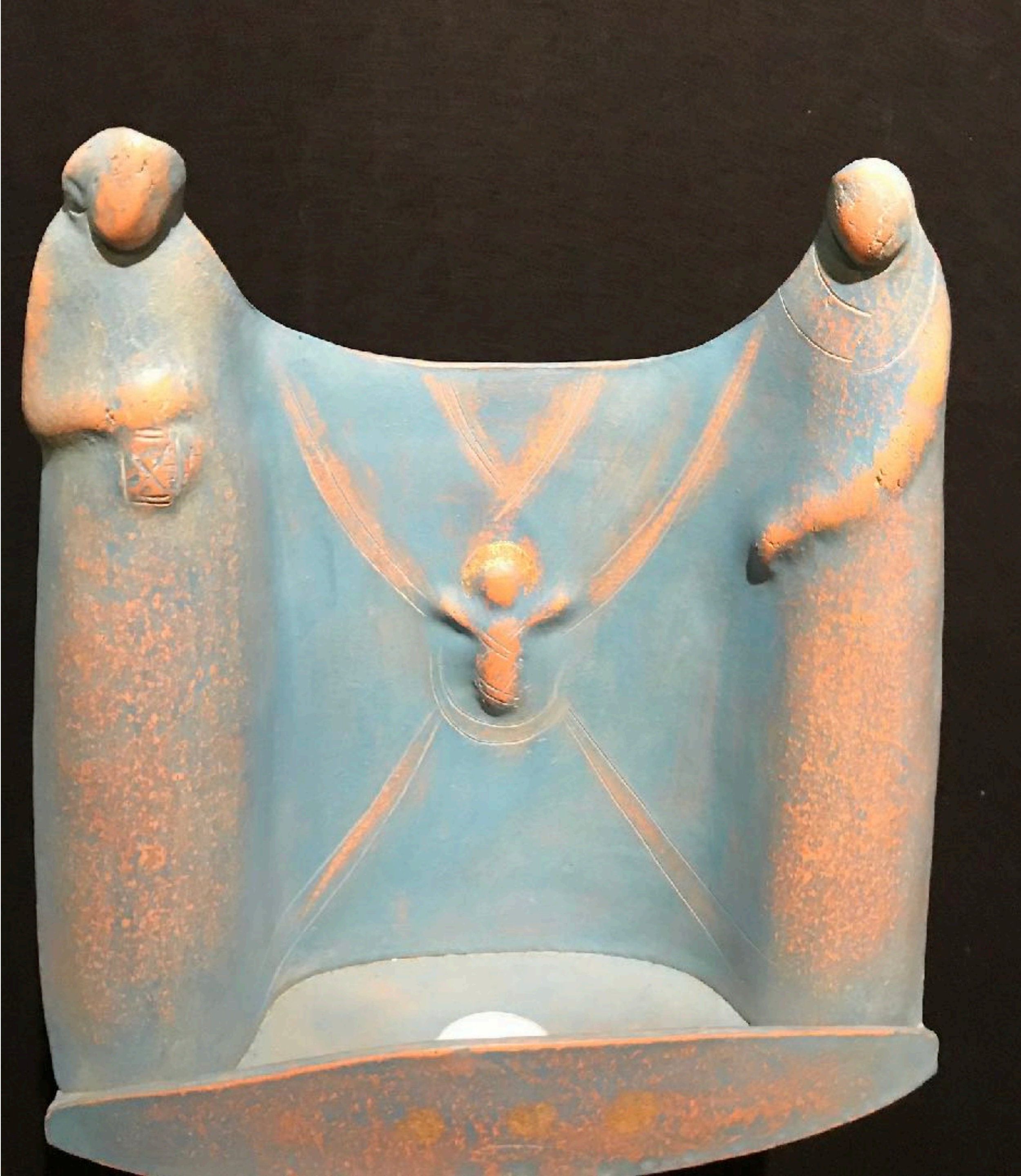
handgefertigte Tonkrippe aus dem Allgäu (D)