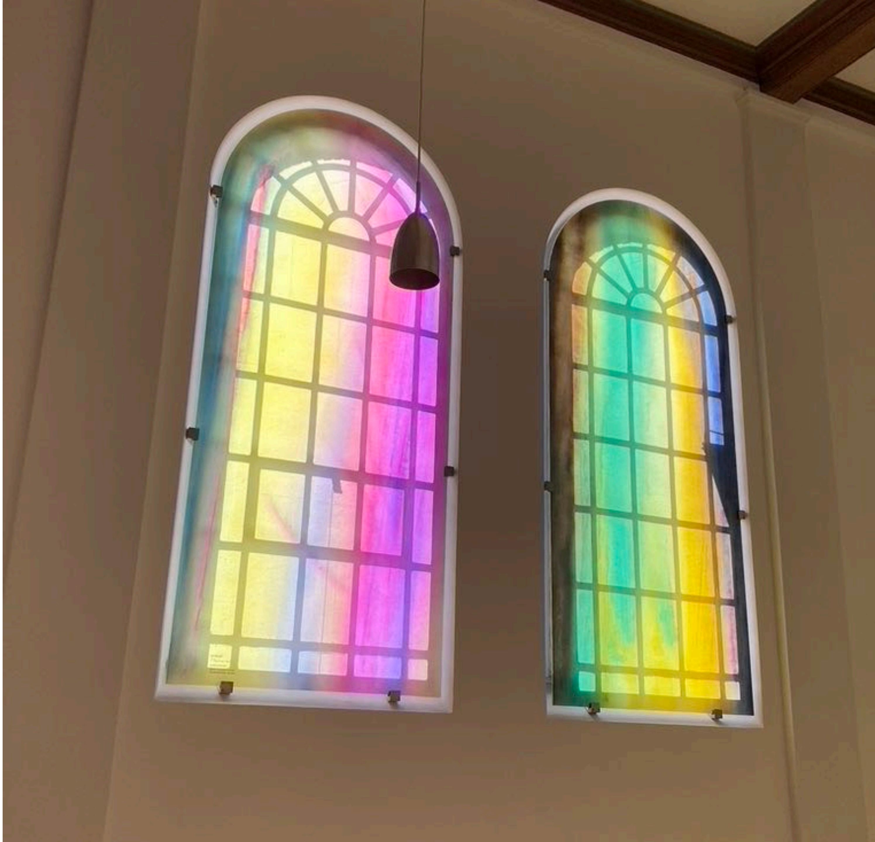
KAPELLENFENSTER bei den Missionsbenediktinerinnen in Tutzing - von P. Meinrad Dufner, OSB Münsterschwarzach