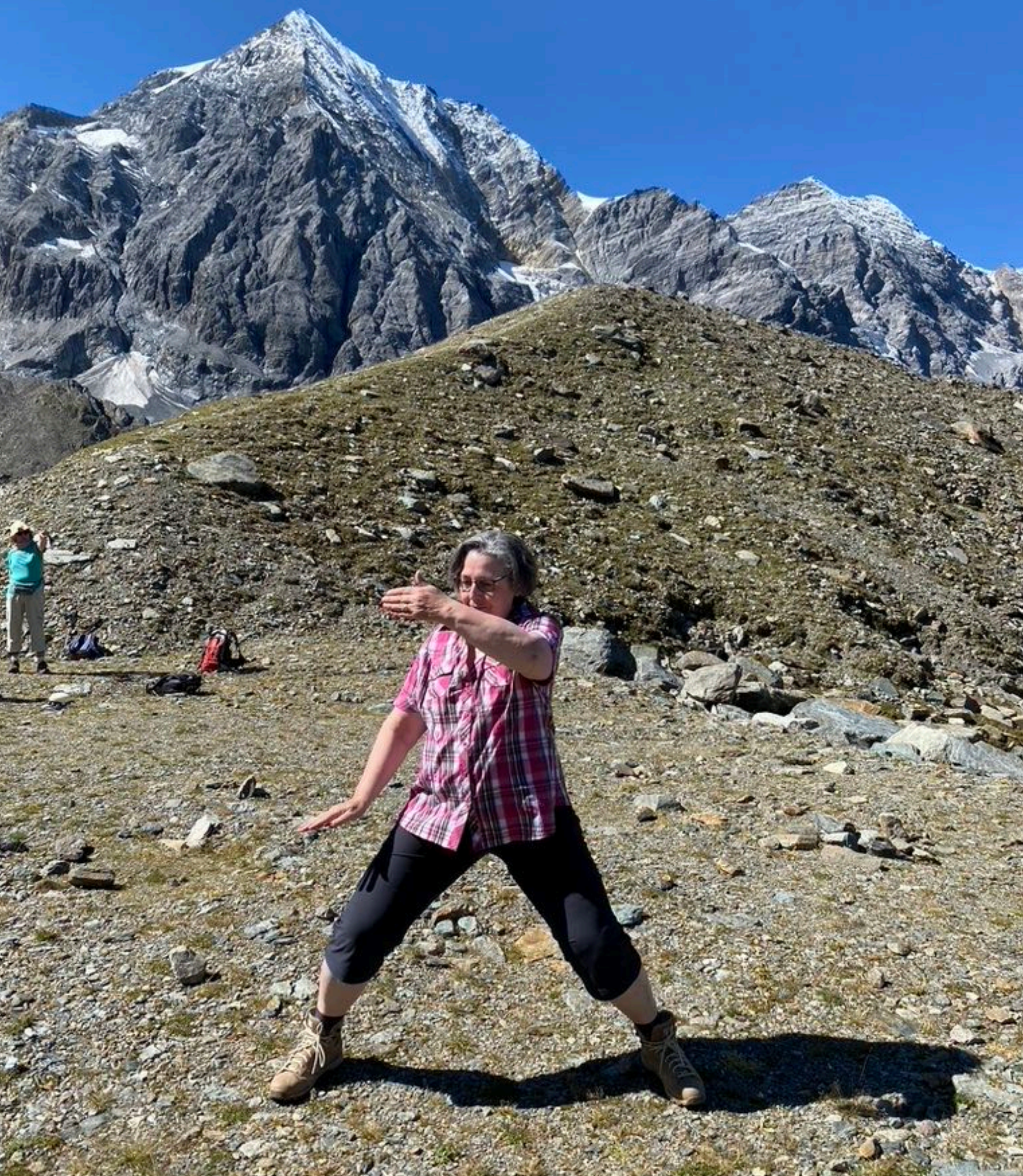
Qigongkurs 2023, Sulden (I)