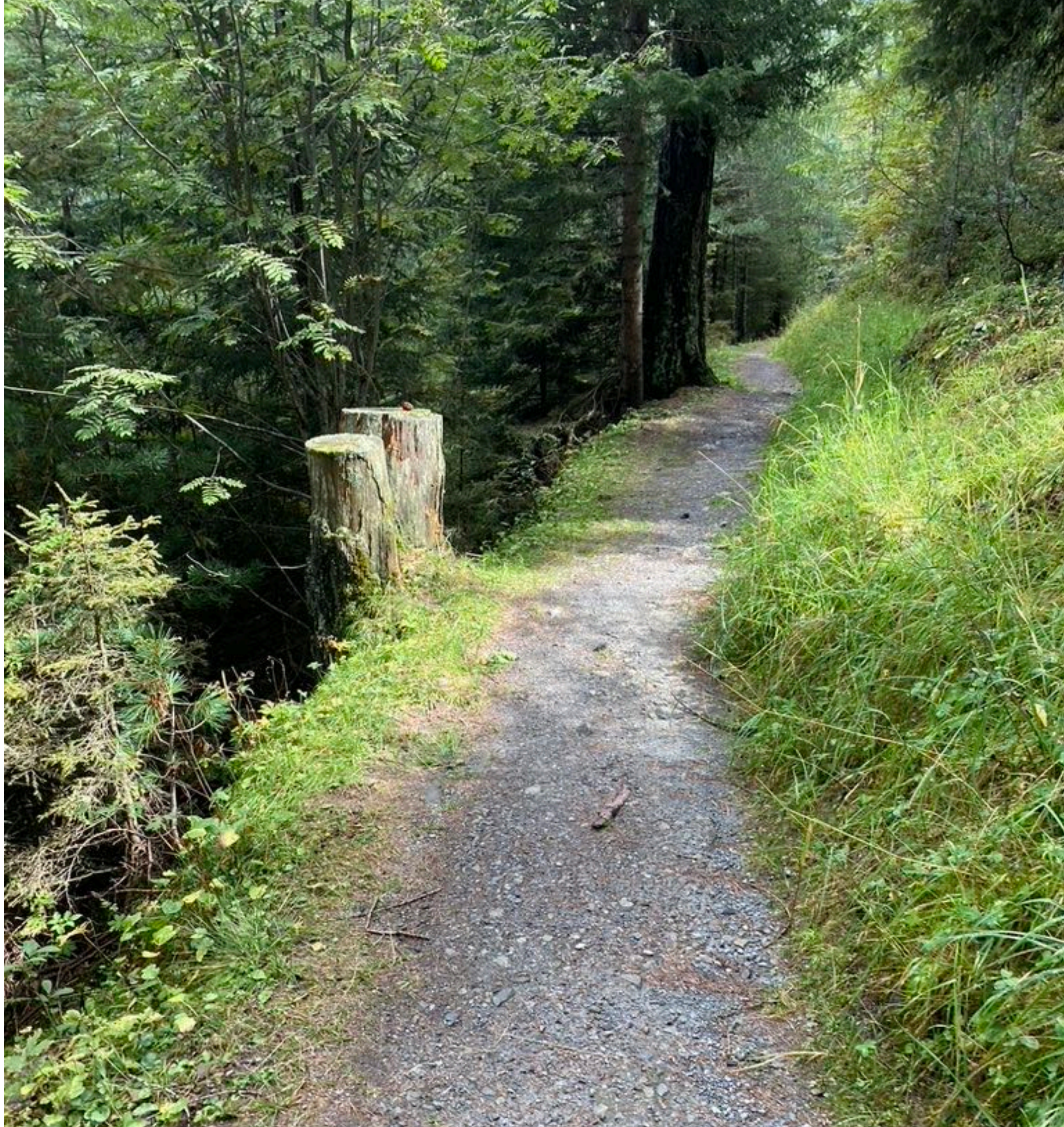
Wanderweg, Sulden (I)